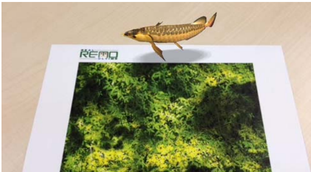
【REMO AR Viewer による表示】

※注) 掲載写真の画面は、はめ込み合成です。実際の画面とは異なる場合がございます。